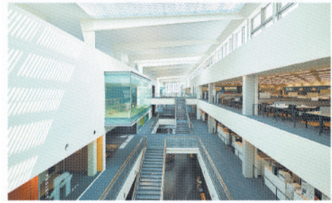
2022年3月に竣工したOECUIノベーションスクエアをはじめ、先進の環境で建築学を学ぶ

上善 建築・デザイン学部は、竹中工務店に設計施工いただいた「OECUIノベーションスクエア」が学びの舞台です。3層吹き抜けのオープンなキャンパスがコンセプト。例えば電子回路を設計する人、ロボットを造る人、プログラミングをしている人が隣り合って学ぶことになります。学生が自発的に考え、自分で突き詰めて研究する学風が本学の強みです。いろんな刺激を受けて、新たなことに挑戦する学部になると期待しています。